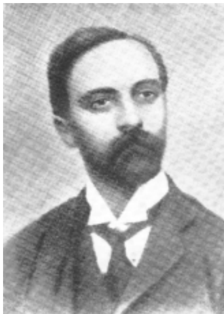
Francesco Saverio Merlino nel 1892

Al fine di evidenziare questi aspetti della sua opera, l'analisi si è incentrata sugli scritti della maturità, intendendo con questa fase l'epoca che va dal 1897 al 1924, anni in cui si verificano l'avvicinamento verso il Partito socialista e l'accettazione del sistema democratico. Merlino è alla ricerca di un sistema politico ed economico che sappia conciliare l'istanza di libertà con la richiesta