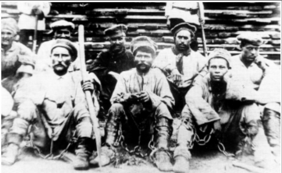
Deportati in catene dopo la fallita rivoluzione del 1905

paganda raggiunge ben presto Tomsk, Krasnojarsk e la flotta del lago Bajkal. In quel periodo vedono la luce numerose traduzioni di autori come Kropotkin (russo, ma che all'epoca, ormai residente a Londra, pubblicava le sue opere in inglese), Reclus e il "nostro" Malatesta per le edizioni Novomirski, letteralmente Nuovo mondo, e sui periodici "Sibirskiy anarkhist" (L'anarchico siberiano) e "Buntovnik" (L'insorto). Oltre che tra i ferrovieri e i contadini, l'influenza anarchica è forte anche tra i 140 mila soldati inviati a combattere le truppe bianche di Koltchak. Proprio la presenza della controrivoluzione impedisce il disarmo, da parte dei bolscevichi, delle bande partigiane anarchiche, che fanno la loro comparsa nella regione dal 1918 e il cui contributo militare, sotto la guida di comandanti come Novoselov e Rogov, è assolutamente indispensabile per la vittoria della rivoluzione. Tuttavia, ben presto i contrasti con i bolscevichi si palesano. Dapprima con la nomina di amministratori esterni alla regione e poi