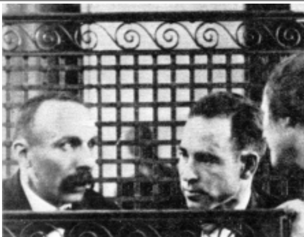
Boston, 1923. Rosina Sacco parla con suo marito e con Vanzetti nell'aula del tribunale

Una storia di ordinaria ingiustizia, che divenne qualcosa di più grande e simbolico, come lo stesso Bartolomeo Vanzetti comprese quando rivolgendosi alla giuria che lo condannò alla pena di morte, disse: "Mai vivendo l'intera esistenza avremmo potuto sperare di fare così tanto per la tolleranza, la giustizia, la mutua comprensione fra gli uomini". Il destino dei due anarchici italiani, capri espiatori di un'ondata repressiva lanciata dal presidente Woodrow Wilson contro "il pericolo rosso", non