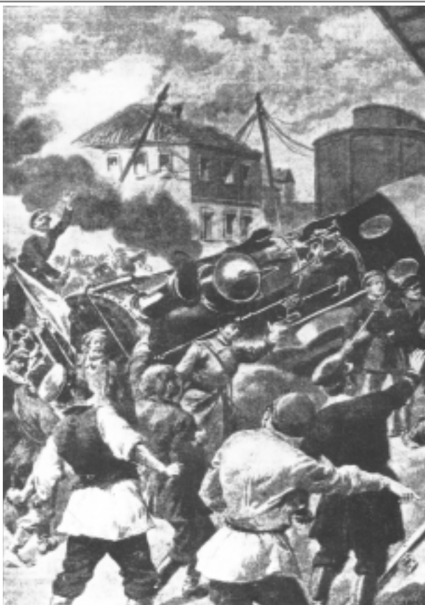
Rivoluzione russa del 1905.

morte mettendosi fra la locomotiva e la vettura ferma. Evidentemente l’urto fortissimo lo fece schizzare via prima che i due veicoli s’incastassero l’uno nell’altro. Gli venne amputata una gamba, il viso rimase deformato dalle cicatrici, dovette sopportare una lunga degenza all’ospedale, ma dopo circa due mesi fece ritorno a casa. Inutilmente i giornalisti e i curiosi che gli facevano visita tentarono di chiedergli i motivi che lo avevano spinto a un gesto tanto clamoroso. Nessuno ottenne risposta. Il Rigosi si man-