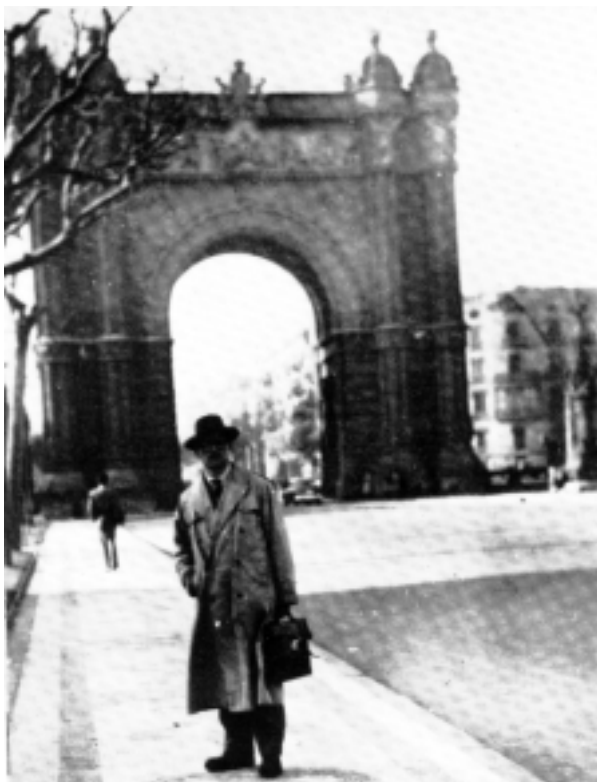
Francisco Sabaté Llopart (detto El Quico) nel 1956. Malgrado sia uno degli uomini più ricercati di Spagna, beffardamente si lascia fotografare davanti all'Arc de Triomf di Barcellona

Tornarono a impugnare le armi e proseguirono la loro lotta in clandestinità, appoggiati da alcuni intellettuali come Albert Camus e traditi dal silenzio complice di molti altri della sinistra europea e americana. L'oblio cui furono condannati non dipese solo dalla vittoria dell'esercito golpista, ma anche dall'indifferenza di parti della sinistra europea.