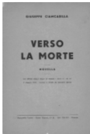
Novella di Giuseppe Ciancabilla stampata nella tipografia di Lato Latini nel 1949

Latini ristampa anche gli opuscoli di Giovanni Gavilli, e nella terza di copertina della nuova edizione di Girella. Ode in risposta ad "Anarchico" di Lorenzo Stecchetti (con cenni biografici a cura di Tito