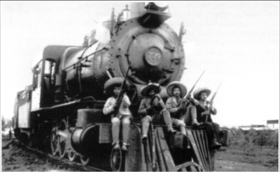
Treno armato durante la Rivoluzione messicana