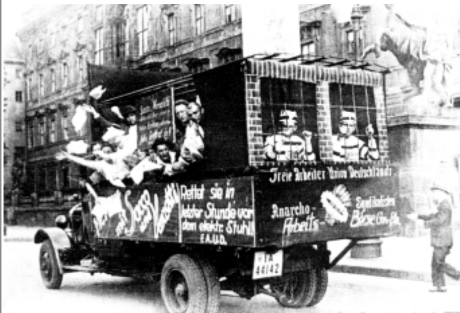
A sostegno dei due anarchici italiani si svolgono manifestazioni in tutto il mondo. Nella foto l'iniziativa promossa da alcuni anarcosindacalisti tedeschi della Freie Arbeiter Union Deutschlands