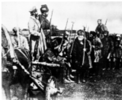
Reparto rivoluzionario contadino durante la Rivoluzione del 1917

Una fallita sollevazione ha luogo nella guarnigione "bianca" di Irkutsk, ma la pro-