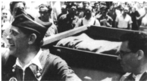
Alla destra Durruti in compagnia del comandante Pérez Farrás

"Balance", Cuadernos de historia del movimiento obrero, n. 25, luglio 2002, Apartados de correos 22010, E-08080 Barcelona