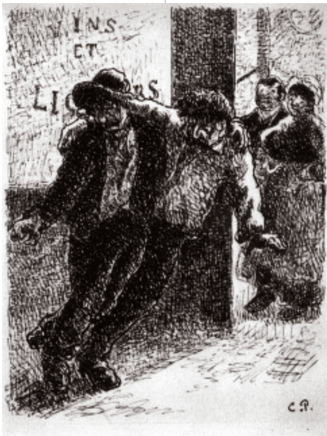
Sopra: Turpitudes Sociales, Les Ivrognes (disegno). Collezione Skira, Ginevra

Noleggio: 50.000 lire d'affitto e 30.000 lire di cauzione, pagamento anticipato, spese di trasporto escluse.