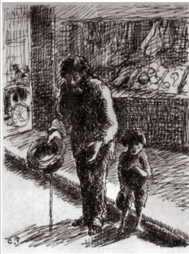
A fianco: Turpitudes Sociales, Le Mendiant (disegno). Collezione Skira, Ginevra.